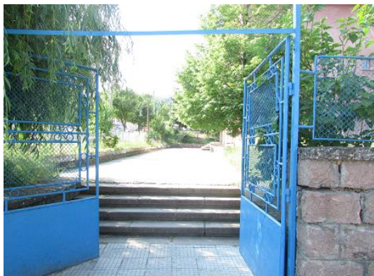
снимка на подходите към входа на училището